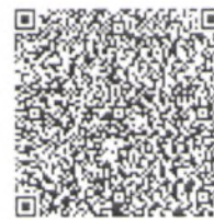
QR код для оплаты

Назначение платежа: орг. взнос за участие (ФИ участника) в конкурсе «Волшебной музыки ручей »